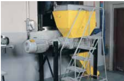
4-SHRED-H egyedi surrantóval és garattal

Megjegyzés: a feldolgozott mennyiség függ az aprítandó anyag jellemzőitől. Kérjük, keresse kapcsolattartónkat.