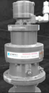
Optionális hidraulikus motorok hidraulikus csomaggal vagy nélkül