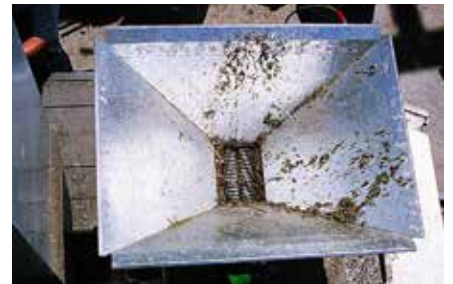
Különböző egyedi gyártású surrantók