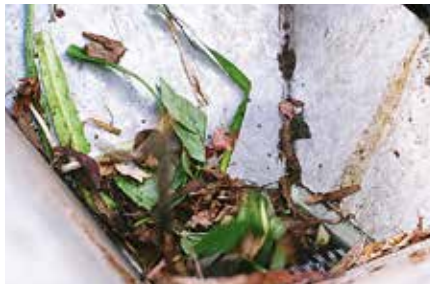
Élelmiszer hulladék aprítás